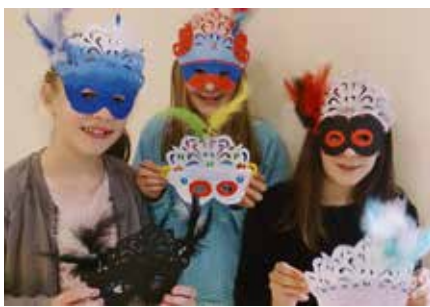
Karneval bei den Space Girls, den Space Kids und Family-Space