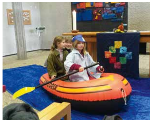
Frühstückskirche in der Friedenskirche „Jona und der Wal“